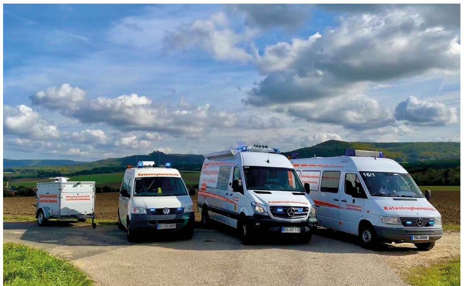
Fahrzeuge der UG-ÖEL Landkreis Bamberg

Fahrzeugen Erkundungs-, Pump- und Transportaufträge zugewiesen. Besonderer Dank gilt allen Einsatzkräften